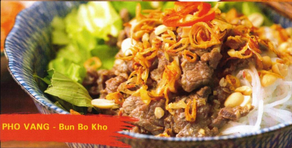
PHO VANG - Bun Bo Kho