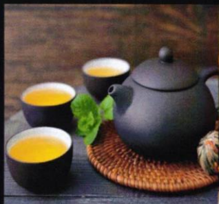
Vietnam - Tee