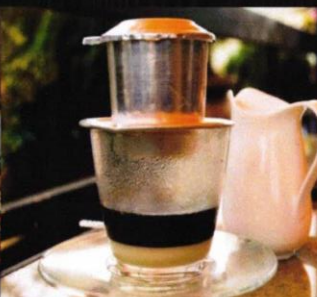
Vietnamesischer - Kaffee